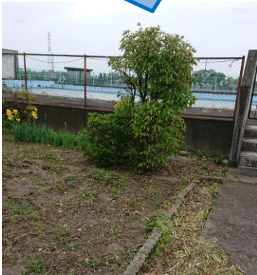
（児童が入るところを丁寧に除草 ：害虫・蛇対策）

職員が点検、安全対策をしますが、安全面を配慮し、遊具周りのへこみ等は、児童と一緒に安全対策の作業を行います。